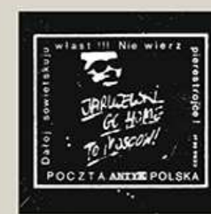
Wydawaliśmy także podziemne znaczki, nasze charakteryzowały się tematyką stricte polityczną.