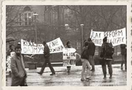
Zorganizowany przez ANTYK protest przeciw referendum. Plac Litewski w Lublinie - 20.11.1987 r.