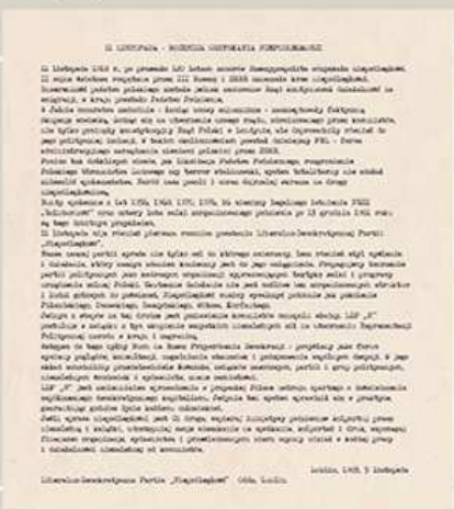
Ulotka rozrzucona w nakładzie 20 000 szt. na terenie Lublina i regionu w 1985 r. w związku z rocznicą odzyskania niepodległości 11 listopada.