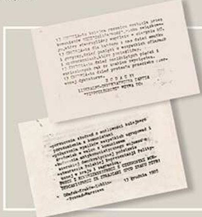
Ulotka rozrzucona z okazji rocznicy wprowadzenia stanu wojennego.