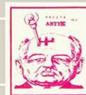
Znaczki wydawane przez ANTYK ukazujące krytyczny stosunek do pierestrojki.