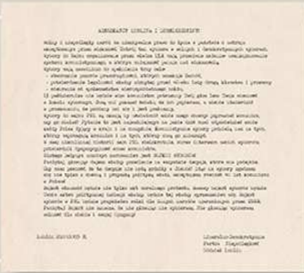
Ulotka rozrzucona na terenie Lublina i regionu w październiku 1985 r. w związku z wyborami do Sejmu